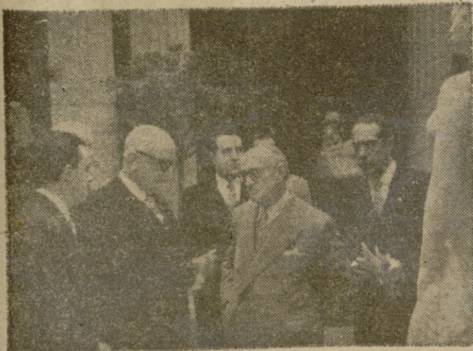
La Bienal de Arte, de Barcelona, continúa siendo visitadísima. En la foto, un grupo de personalidades catalanas con el Alcalde de la Ciudad, durante el acto de la inauguración.—(Foto Cifra).