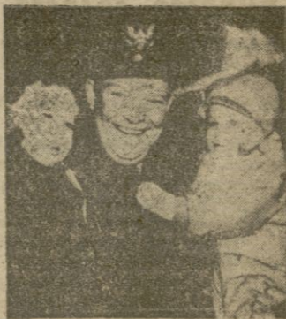
Eisenhower, en una escena familiar. Es padrino de Craig "junior"

Agenas pisó Palma y el Hotel Maricel, donde se hospedó, entrevistamos — a pesar de las naturales y despreciativas interferencias — al Teniente Coronel del Ejército de los Estados Unidos, en misión oficial en Europa, Mr. C. Craig Cannon, ayudante de campo del general Eisenhower.