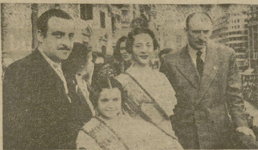
COMIENZAN LAS FIESTAS FALLERAS Valencia. — La fallera mayor e infantil junto al Alcalde y Presidente de la Junta Central Fallera, en el balcón del Ayuntamiento desde donde invitó a los actos de dichas fiestas.

Agenas pisó Palma y el Hotel Maricel, donde se hospedó, entrevistamos — a pesar de las naturales y despreciativas interferencias — al Teniente Coronel del Ejército de los Estados Unidos, en misión oficial en Europa, Mr. C. Craig Cannon, ayudante de campo del general Eisenhower.