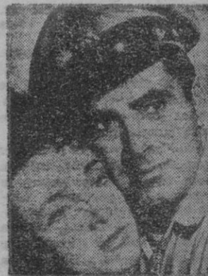
Una escena de "Guerrilleros en Filipinas".

Otra película de guerra y de propaganda. "Guerrilleros en Filipinas", dirigida por Fritz Lang, es un film hecho con muchos recursos, con buenos intérpretes, con un asunto estereotipado, que va sin fallos hasta dar con el blanco. El blanco o diablo es que los soldados americanos son unos tipos estupendos, bravos, que no hay obstáculos para ellos en ningún sentido y que, hasta en la selva y con borra de varios días, saben guiar el ojo a las chiecas con muchísimo saqueo. El público todavía no ha dicho que "no" al género y se sigue