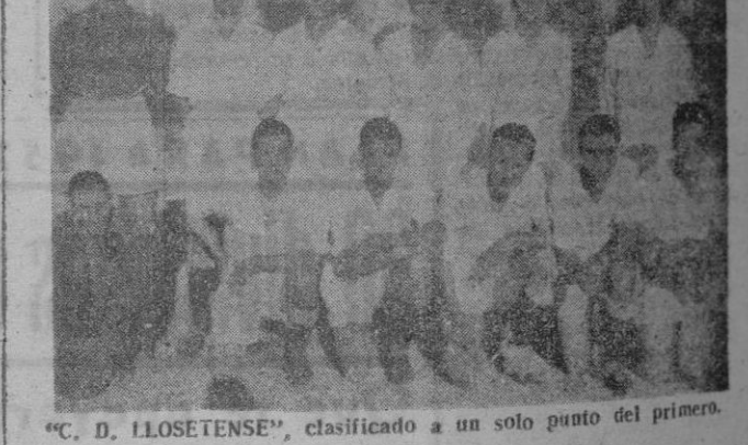
"C. D. LLOSETENSE", clasificado a un solo punto del primero.

HOSTALET — R. MALLORCA Otra vez frente a frente estos