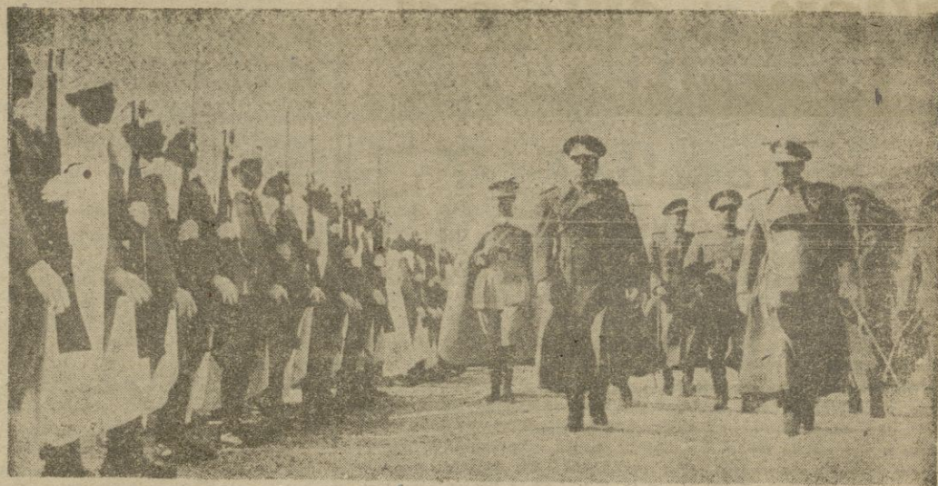
CEUTA.—El Alto Comisario de España en Marruecos, Teniente General García Valiño, revista las fuerzas que le rindieron honores a su llegada al poblado de Bizut, para inaugurar el monolito erigido para conmemorar el hecho donde hace treinta y seis años, durante la campaña de Marruecos, fué herido S. E. el Jefe del Estado, entonces capitán de Regulares.