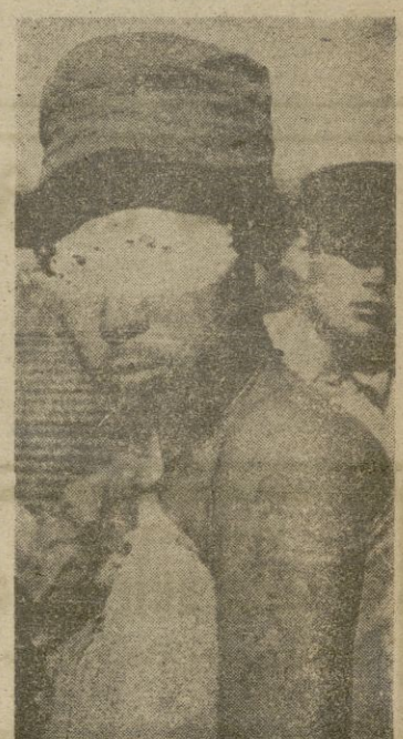
Isla de Kojá (Corea del Sur).—Este prisionero rojo, cuya fotografía ha sido raspada en parte de la cara para evitar posibles represalias contra sus familiares, muestra tatuado en un brazo un "slogan" anticomunista. 12.000 de estos prisioneros capturados en la isla muestran tatuajes parecidos, grabados en su sangre, pidiendo a los Altos oficiales aliados no ser repatriados.