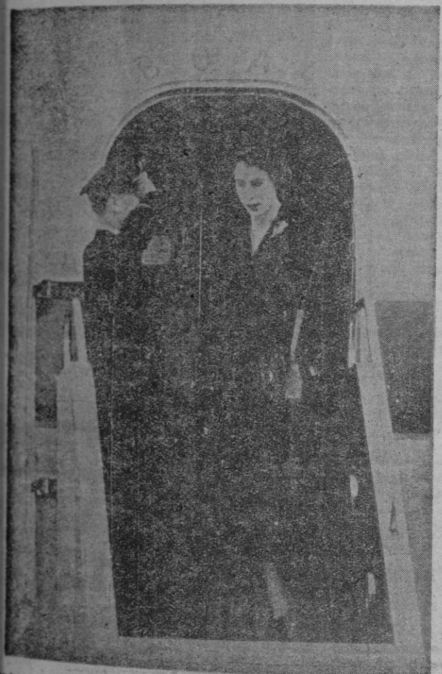
Londres. — Un momento de la llegada a esta capital de la Reina Isabel II de Inglaterra, acompañada de su esposo el Duque de Edimburgo. En el aeropuerto era esperada por los miembros del Consejo Privado

LLEGADA A LONDRES DE LA NUEVA REINA DE INGLATERRA