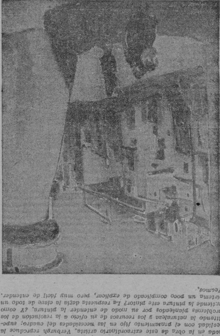
"Calle de Ibiza", óleo de Medard Verburgh

Esta exposición de Verburgh en círculo de bellas artes, no va una temporada, sino hasta una época. No es un secreto, pero nadie el hecho de que Medard Verburgh es un pintor excepcional.