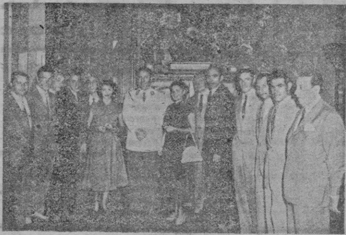
Buenos Aires. — El General Perón con los ases del ciclismo europeo que fueron invitados para tomar parte en las pruebas inaugurales del gran Estadio que lleva el nombre del Presidente...