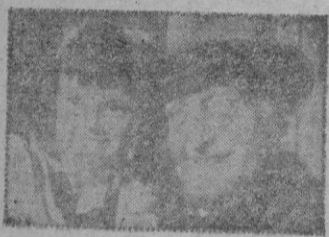
Una escena de la película.

Josef Von Baky, con un estilo bien directo, splendo a la calle en busca de esa verdad cotidiana que hoy intenta el cine, nos hace vivir el amargo Berlín que nació de la guerra, el Berlín convertido en ruinas, ruinas morales y físicas y que sólo el esfuerzo de los honrados, al fin, habrán de volver a levantar.