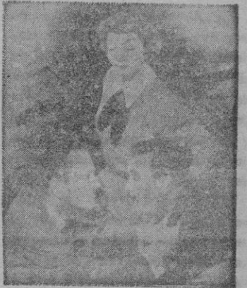
Los protagonistas del film.

Se dice gran parte, por lo menos, de lo que sugiere «Se vende una novia», que ha nacido de una novela de puro entretenimiento y a la que fuera de esto, no vale pedir más, pues la película da en el blanco de la riva, su meta.