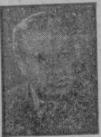
F. DE URRUTIA

ca fundamental. Esto es lo que llamamos "Escuela ProvidenciaLista". Pero frente a este criterio nuestro, están la "Escuela fatalista" de Vico, quien considera indiscutible la independencia de tres periodos: Divino, heroico y humano; la "Escuela idealista" de Hegel que cree que todo lo histórico es solamente la plasmación en moldes humanos del espíritu del Derecho en sus manifestaciones de justicia y libertad; la "Escuela positivista" de Augusto Comte, que divide las interpretaciones en teológicas y positivas; la "Escuela evolucionista" de Heriberto Spencer, que representa un sentimiento biológico y que comprende la Historia como una evolución desde lo homogéneo a morfo hacia lo homogéneo organizado; la "Escuela relativista" de Spenser, que juzga a la humanidad como un mosaico de culturas distintas sin relaciones de vínculo o cronología y la "Escuela materialista", representada por Carlos Marx y Federico Engels, que afirma que el factor económico es el que determina el desarrollo histórico al mismo tiempo que crea las características fundamentales de la cultura y que solo los modos de producción, dan la clave del origen de las sociedades y sus avatares.