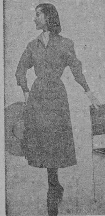
La de arriba es un modelo para los días de sol. Blusa de jaretas, escote sin cuello y amplio pliegue en la falda, que oculta los botones. El de abajo, sencillo y de precio módico, ha de constituir uno de los máximos atractivos en la próxima primavera. Está realizado en lanilla de cuadros.