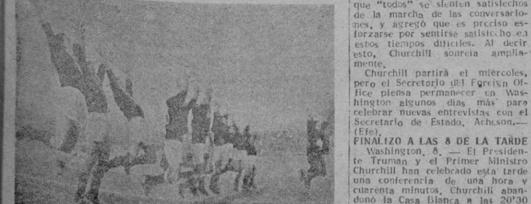
Los kiwis de Nueva Zelanda lanzan "su grito de guerra" antes del partido de rugby celebrado en París, donde perdieron por ocho a tres. Terminado el partido, los que saltaron y gritaron fueron los franceses.

En una breve declaración facilitada por la Casa Blanca, después de la reunión, se dice que el Presidente y el Primer Ministro continuaron el estudio de cuestiones militares, y trataron también los problemas planteados en el Oriente Medio y el Extremo Oriente.