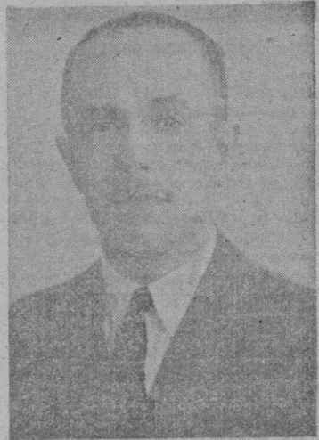
Vice Cónsul, le deseamos muchos años de estancia y de prosperidad entre nosotros.

UNIS A ASISTIR AL MAYOR SUCESO QUE VIERON LOS SIGLOS, DESPUES DE LA ENCRANTACION DEL HIJO DE DIOS. LOPEZ DELA GOMARA