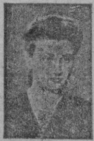
C. COLL HEVIA

Solo se lleva un pesar a la tumba: —"No he hecho nada para la posteridad". Pero la posteridad ha escrito indeleblemente las letras de su nombre con la sangre derramada de su poético heroísmo.