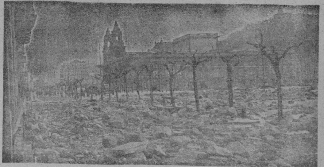
San Sebastián. — Las aguas invadieron algunas calles de la parte vieja del barrio de Gros causando destrozos. He aquí un aspecto de una de las calles del barrio citado, después de amainar el temporal.

Teherán 3.— El Primer Ministro persa, Musádeq ha rechazado las bases del plan del Banco Internacional para la dirección de la industria petrolífera. En contestación al Vice-presidente del Banco, Robert Oranner, quien le escribía una carta que ponía doce puntos de base, Musádeq ha rechazado varios puntos y no pidió aclaración a otros. Indica que no se permitirá a los representantes del Senado votar las zonas petrolíferas, a no ser que se reciba una respuesta satisfactoria. — Efe.