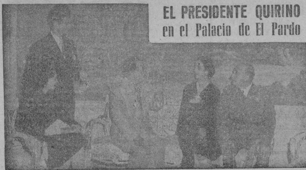
EL PRESIDENTE QUIRINO en el Palacio de El Pardo

Madrid.—Con motivo de la onomástica de S. E. el Jefe de Estado, en el Palacio Nacional se colocaron pliegos que fueron rápidamente llenados de firmas por millares de madrileños que quisieron manifestar de este modo su adhesión a la persona del Caudillo de España.—Cifra.