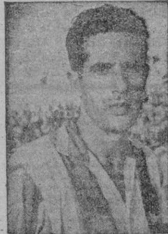
GERMAN el hombre que tendrá la misión de anular a Barrera.

disputarle al Atlético Baleares en Son Canals.