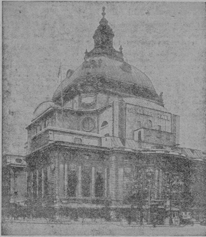
El edificio de la ONU en Londres atento al Pacto