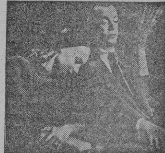
Una escena con Denis O'Keefe.

Hollywood, de cara a hacer frente al renacimiento del gangsterismo —en la postguerra— lanzó una larga serie de películas exaltando el espíritu y los medios policiales de que Washington dispone para perseguir la criminalidad.