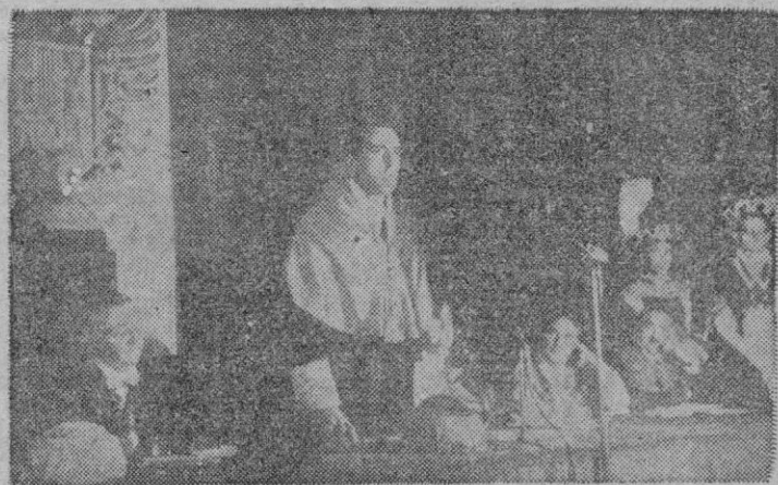
Santander. — El Ministro de Educación Nacional, señor Ruiz Jiménez, durante su disertación en la clausura de curso de la Universidad Internacional Menéndez y Pelayo.

Copenhague 8.—En la clausura del II Congreso Internacional de Poliomielitis celebrado en esta ciudad, se anuncia que ha sido nombrada una comisión encargada de estudiar la formación de una Organización mundial para ampliar la lucha contra la parálisis infantil. Los informes que han presentado los delegados ante aquella conferencia revelan un sustancial progreso en los métodos de tratar a las víctimas de aquella enfermedad.—Efe.