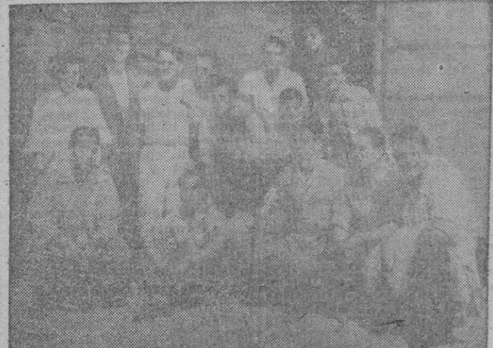
El equipo del "Levante" posa para los lectores de BALEARES a la puerta del hotel donde se hospeda.

La falta de acoplamiento en los cuadros hace muy difícil el aventurarse en los pronósticos. —De acuerdo. ¿Es Riera, el que