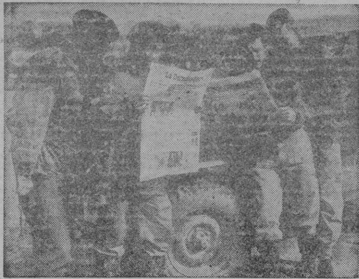
En Corea saben los combatientes los deseos de pacificación

Entretanto, sin embargo, ha cambiado el carácter de la amenaza potencial en el Sureste del Pacífico y de los Antipodas. No es a un Japón revivido al que hay que temer en un futuro relativamente istante. Hay una más inmediata amenaza, que es la del agresivo imperialismo chino-soviético.