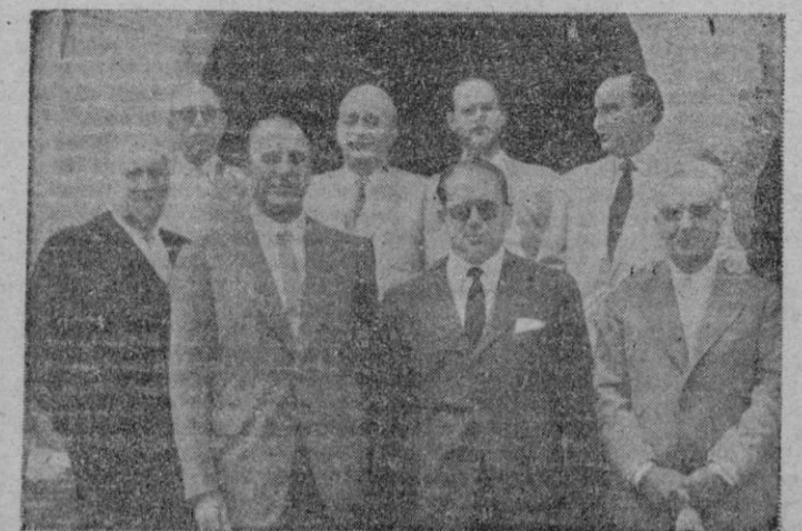
Pdencia (Vizcaya). — En este pueblo veraniego, y en la residencia del Presidente del "Atlético de Bilbao", se reunió en la Federación Nacional de Fútbol, cuyos componentes aparecen en la fotografía