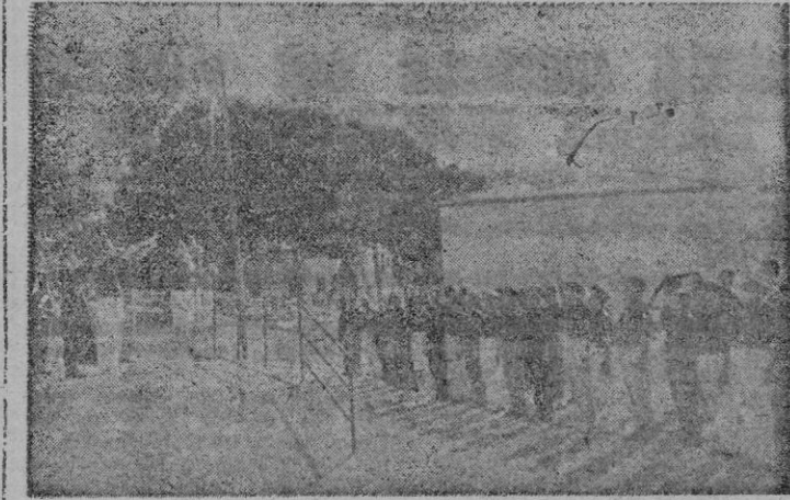
DOS ASPECTOS DEL ALBERGUE

El Arenal donde precisamente lo mínimo del conjunto, la parcela de sus instalaciones, el cuidado rincón de la negra Cruz que extiende sus brazos al infinito sobre repisa de yugos y flechas, lo que exija del análisis. Hay, sobre todo ello, un conjunto apretado — haz granado en el templo de elevarse a las alturas — de camisas azules, falangistas por sentir, maestros por devoción, que fácil son entender y comprender con nuestras mismas reacciones, con idénticas palabras.