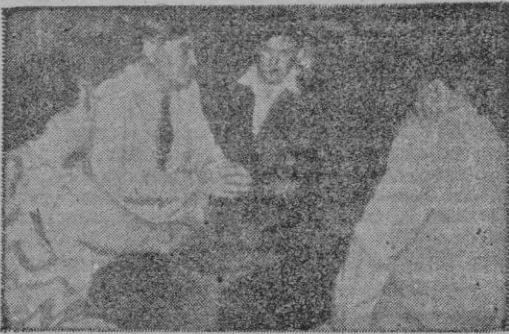
El dictador Tito, y Mr. Bevan, laborista, se «aproximan» en Yugoslavia

se comprenda la futura valía del primer pueblo vencedor del comunismo, hoy, ya, recibiendo las prebendas que cumplen a su dignidad, gallardía y recta actuación política. No es extraña, pues, la inquina y el furor de los laborismo inglés y socialismo francés frente al resurgimiento potente de una España, que obligaría a las naciones que mal representan a marchar a su paso. Estados Unidos confía en España para que Europa no tenga que ser liberada. Esta es la gran realidad del momento presente.