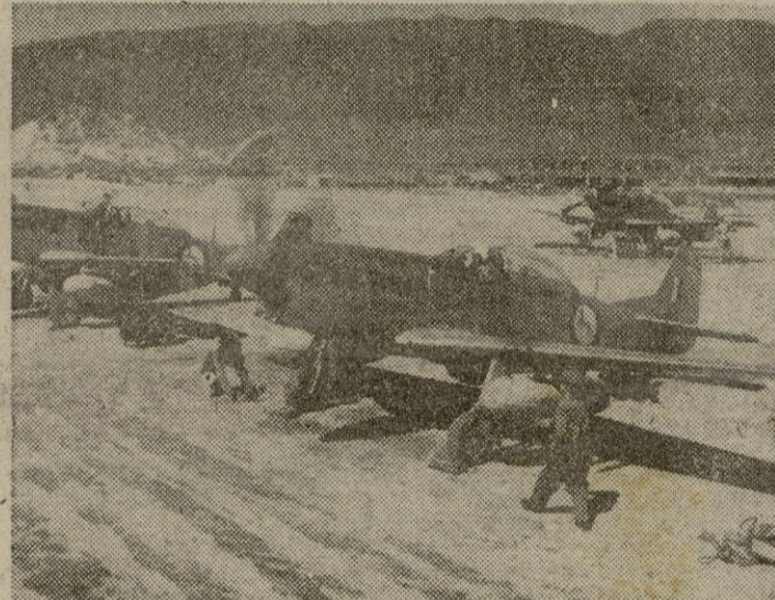
LA LUCHA EN COREA: Infantería griega, encuadrada en las fuerzas de las Naciones Unidas que luchan contra la agresión comunista en Corea. — TAMBIEN LUCHAN LOS BELGAS: Grupo de soldados belgas, encuadrados bajo la bandera de las Naciones Unidas, para responder a la agresión comunista. — CAZAS SUDAFRICANOS EN COREA: Escuadrilla de cazas sudafricanos destacada en Corea, lista para iniciar una de sus misiones contra los objetivos comunistas.