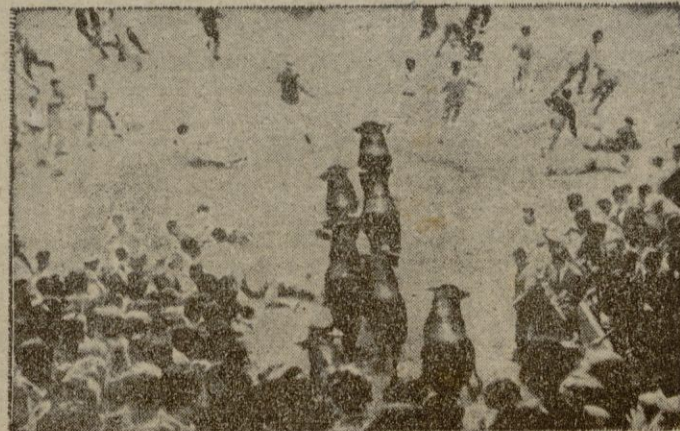
Pamplona. — La fotografía recoge el momento de hacer su entrada en la Plaza las reses, que se lidiaron en las corridas de Feria, en el clásico encierro. La mocedad corre delante de los toros entre el bullicio de los espectadores.