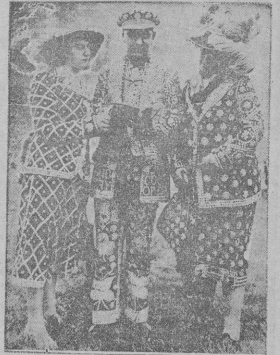
Los conocidos "reyes de las perlas" ingleses se presentaron así, de acuerdo con una vieja tradición, sobre la que puede polemizarse en torno al buen gusto, en la feria hipica que señala la cumbre de la temporada inglesa. El Derby de Epsom se vio alegrado con estos jacarandosos trajes