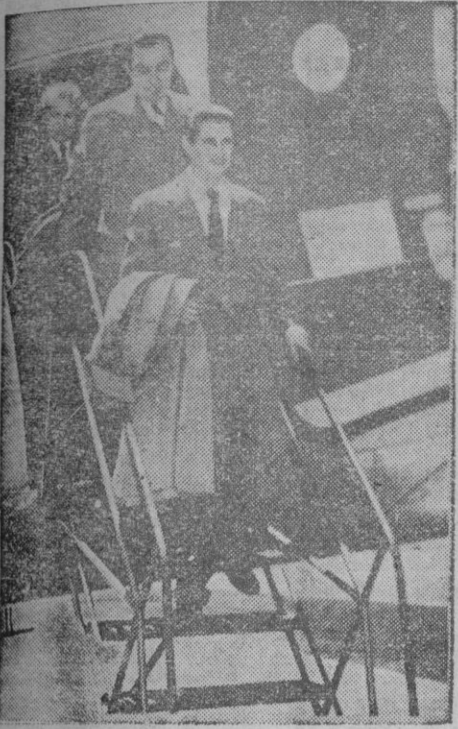
Milán. — Procedente de España y de paso para Turín, ha llegado a esta ciudad el Marqués de Villaverde, que asistirá en la segunda de las capitales citadas y en calidad de invitado de honor a la Exposición Sanitaria y a las conferencias internacionales médico-quirúrgicas, donde pronunciará, a su vez, una de las conferencias. — (Foto Cifra Gráfica)