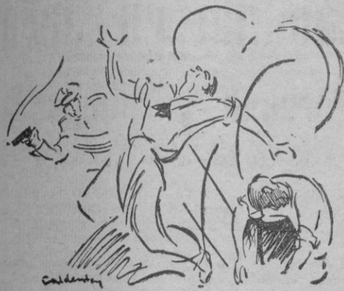
"Triunfo de la diplomacia", Firma el cuadro: "Occidente"

los soldados unidos — sobre la declaración formal de Rusia de proteger el Norte de Corea si las fuerzas de Mac Arthur rebasaban el paralelo 38? ¿Llegar al Yalu era finalizar victoriosamente una guerra limitada? Si justo fué alabar en su momento la táctica de retroceso de las Naciones Unidas, la crítica se impuso al cruzar el paralelo 38 por vez primera. Lanzar la piedra, atar las manos y recibir después en pleno rostro los golpes, sin responder, por mor a que el castigo sea mayor, solo cabe, políticamente, en la "habilidad" diplomática de la Casa Blanca. ¿Dónde ha de terminar, hoy, el actual conflicto coreano? ¿En unas tablas a 38? ¿Y si Rusia, lo más factible, por mediación de su China comunista, dijera rotundamente: ¡no! ¿No sería el mundo libre el incendiario de guerra propalado desde el Kremlin? Fracaso, gran fracaso, de la táctica diplomática, al callar los cañones, único diálogo a entender por Rusia. Pues el lenguaje de fuego de hoy es la mayor de las crueldades estériles. Corea es solo un intercambio de territorio por hombres Y, aun, ni siquiera de territorio.