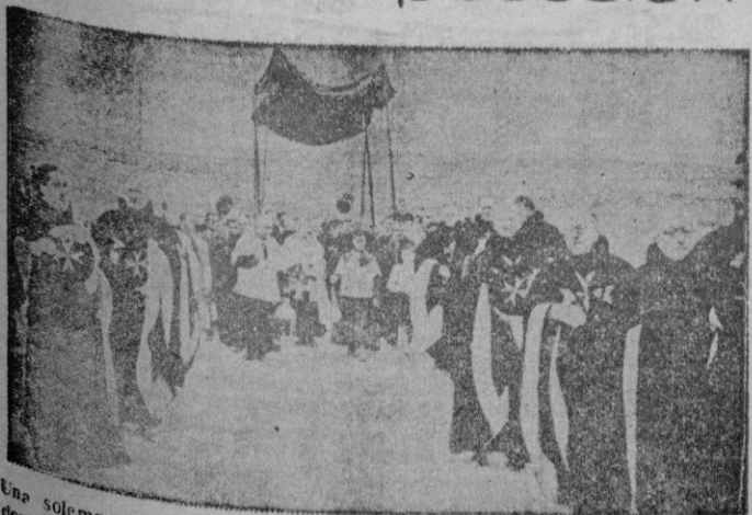
Una solemne procesión con el Lignum Crucis — un trozo del brazo derecho de la cruz de Cristo — fué celebrada por los Caballeros de Malta, en Segovia, con motivo de la toma de posesión de un templo que ha sido cedido por el Gobierno a dicha Orden militar