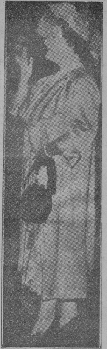
La reina de Inglaterra despidió en la estación Victoria, de Londres, a sus augustos huéspedes los soberanos de Dinamarca, que han pasado unos días en la capital inglesa. A la despedida asistieron también las princesas reales y otros personajes.

Tokio 17. — Los comunistas irrumpen en número creciente por la brecha que abrieron al sur de Inje, por en cima del paralelo 38 y que obligó a los surcoreanos a la retirada.—Efe.