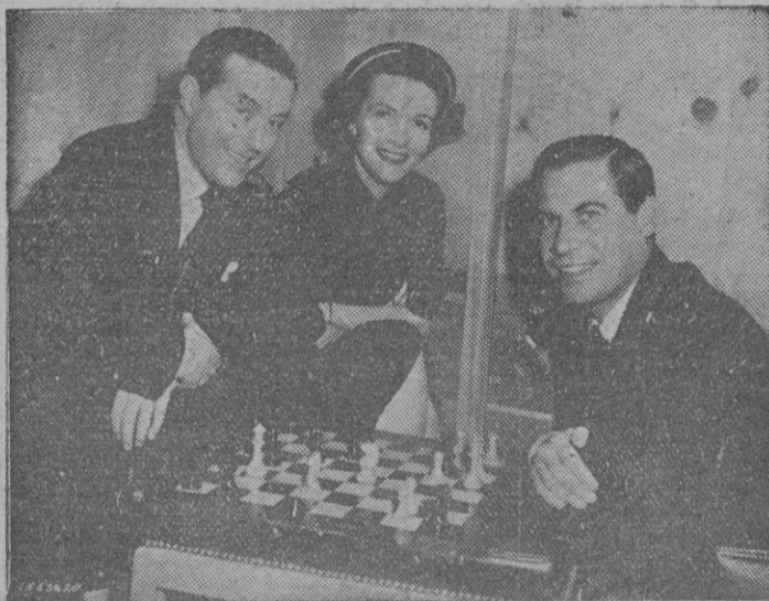
Entre escenas de la cinta “La ilusión nunca muere”, sus estrellas, Ray Milland, John Hodiak y Nancy Davis, se distraen jugando al ajedrez