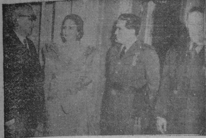
Hace veinticinco años el actual Ministro del Aire, general Gallarza, remataba, en unión de sus compañeros, un triunfal raid Madrid-Manila. Aparece hoy el general con los embajadores de Filipinas y el ministro de la misma Embajada durante la fiesta conmemorativa que se celebró en recuerdo de aquella fecha gloriosa de nuestra Aviación.

Tokio 17. — El comunicado del Cuartel General, de hoy jueves, dice que la acción en Corea, en la jornada de ayer, fué moderada en los sectores Este-Central y Oriental, donde las fuerzas de las Naciones Unidas llevaron a cabo retiradas limitadas, mientras la presión de los rojos iba en aumento. En los sectores Occidental y Oeste-Central, elementos de econocimiento aliados tuvieron pequeños contactos con grupos comunistas, que aparecieron esporádicamente.