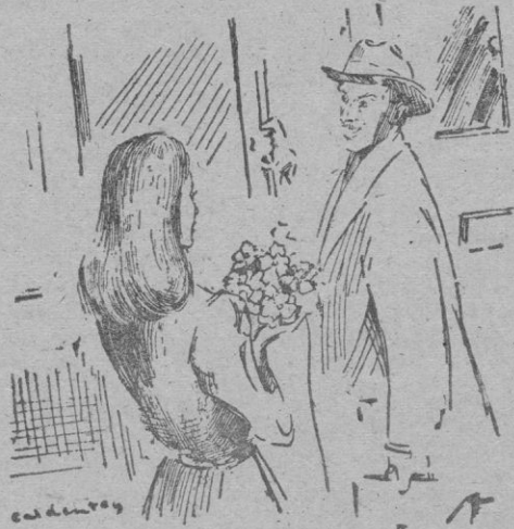
Una muchacha le ofrece un ramo de flores...

La eficacia de los interrogatorios no estaba en lo "técnico", sino exclusivamente en lo psicológico.