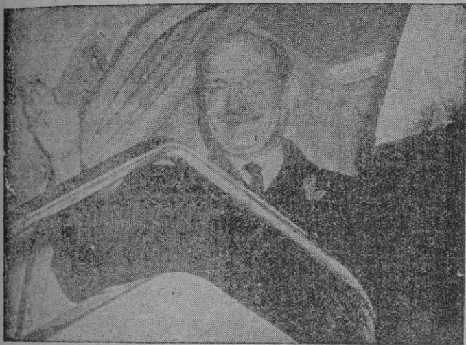
Attlee, un enfermo al servicio de Moscú

Valorando las dos políticas — la de Attlee y la de Mac Arthur —, es fácil comprender que la diplomacia del "premier" inglés ha triunfado sobre la destitución del general por su carácter eminentemente comunista. Fué el Kremlin quien destituyó a Mac Arthur, a través de la orientación europeo británica. Truman, ni siquiera es responsable de la destitución del general, sino mero concesionario de exigencias rusas.