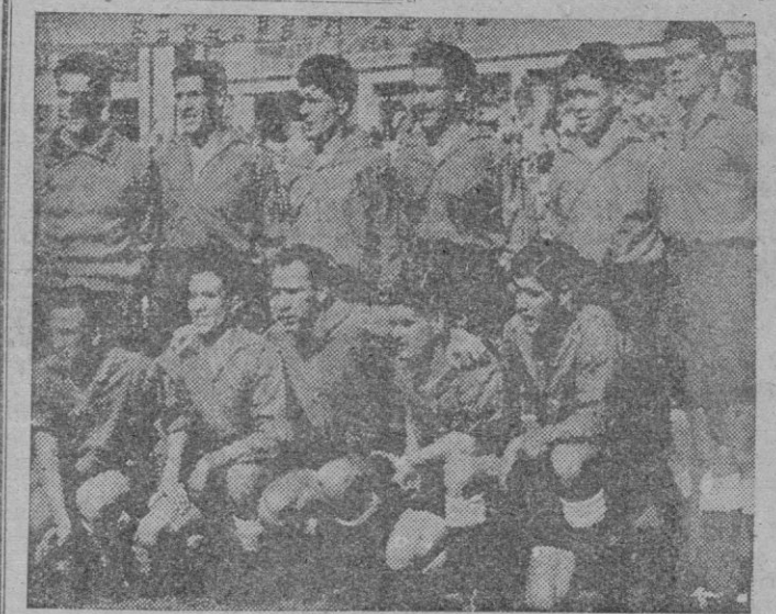
En la parte superior, un remate de Alsúa durante el partido jugado el jueves entre el "Stade de Reims" y la Selección Española de Fútbol. Abajo el equipo nacional que consiguió la victoria sobre los franceses por dos tantos a uno.