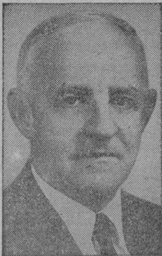
Frank P. Graham, exsenador norteamericano, que acaba de ser nombrado Administrador de la Mano de Obra de Defensa en el Departamento norteamericano de Trabajo