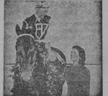
(Una escena de la película)

No es la primera vez que la pantalla nos refleja la apasionante vida del "tur", pero quizá sí, la historia de un caballo real; con carreras reales, como lo demuestran aquellas dos secuencias en que de repente el technicolor se trueca en blanco y negro para dar paso a fragmentos de auténtico noticiario.