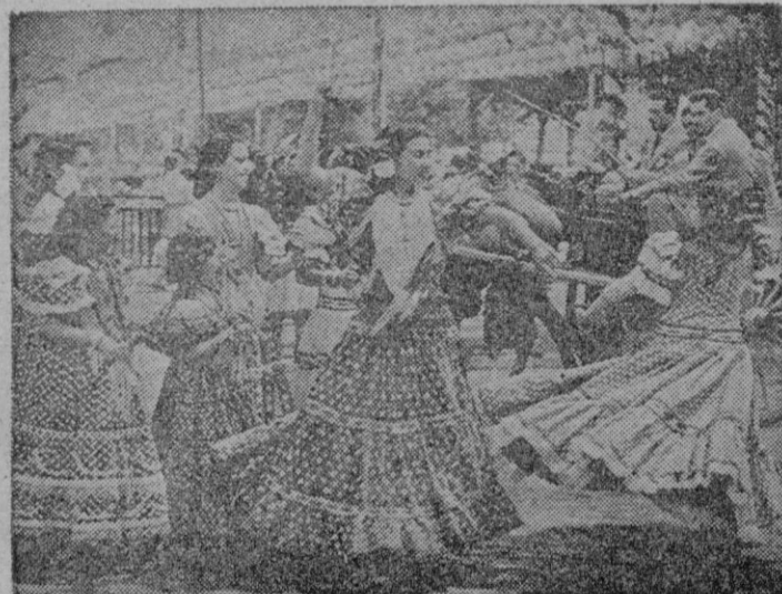
Sevilla. — La feria sevillana se ha celebrado con gran animación y alegría, siendo visitada por personalidades y turistas llegados a esta capital con tal fin. He aquí a un grupo de muchachas en una exhibición de bailes en la feria.

Washington. — En tucientes norteamericanas se dice que se ha llegado a un acuerdo tácito sobre el ataque a Manchuria como resultado de las conversaciones que se han celebrado en esta capital y que este acuerdo no afectaría a las tropas de tierra de las Naciones Unidas en Corea.