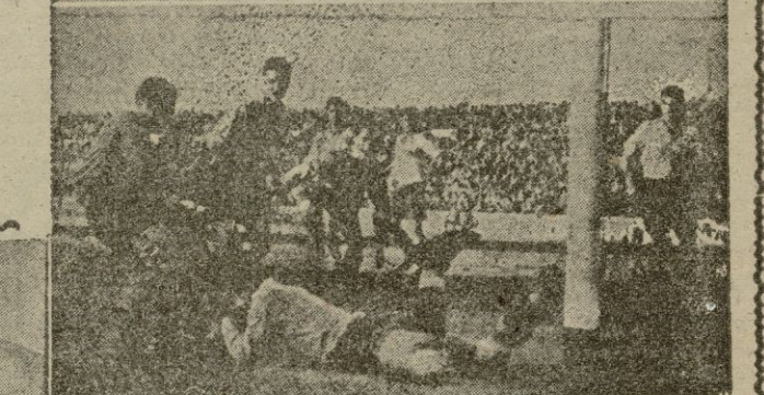
El portero de las Palmas desviando a corne. un peligroso tiro de Manolo. Otra intervención del meta canario evitando un peligroso remate de Sanz. Y en último lugar Manolo en salto acrobático evita lesionar al meta canario que valientemente se lanza a sus pies para evitar un gol seguro.