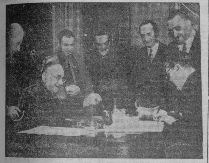
Madrid. — El Ministro de Asuntos Exteriores, Sr. Martin Artajo, y el Nuncio de S. S., Monseñor Cicognani, durante el canje de los instrumentos de ratificación del convenio suscrito entre la Santa Sede y España sobre la jurisdicción castrense.