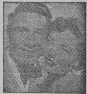
Gene Tierney y Richard Conte en una escena.

Aquí, en "Voragine", el relato está en manos de un caso de complejos psíquicos, de un aventurero de mucha maña para las señoras desocupadas y con dinero, un psiquiatra lleno de trabajo y que diligentemente tiene un minuto para su esposa y el correr de una historia que se complica hasta el melodrama, aunque sin escapar de lo aburrido.