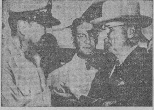
Los observadores estiman que...