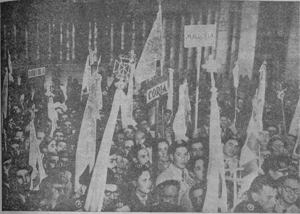
Roma. — Peregrinos españoles de Mondoñedo, Eoria y Mallorca fotografiados en la Plaza de San Pedro momentos antes de penetrar en la Basílica vaticana, con motivo de los actos de la proclamación del dogma asuncionista.