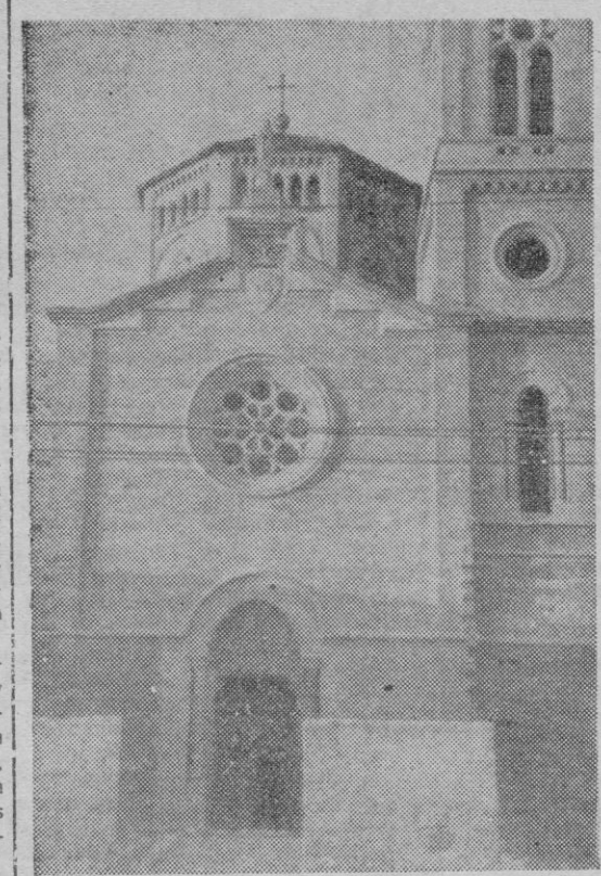
A las 6 de la tarde, recibirá a las Juntas de A. C. de la Parroquia.

Una vez terminada la Comunión General, el Reverendísimo Sr. Obispo visitará los centros de Enseñanza de la Parroquia.