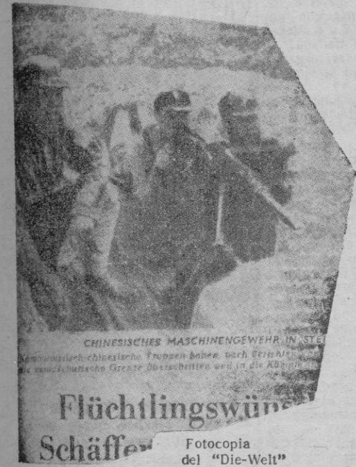
Flüchtlingswünsche Schäffer Fotocopia del "Die-Welt"

Coincidiendo con el avance de las fuerzas de las Naciones Unidas y la menor presión de los ejércitos comunistas, la delegación china de nueve miembros salió de Pekín con dirección a Nueva York. El acuerdo de paz del Tibet con los invasores se ha logrado mediante la conquista por las armas del territorio de los Lhamas, es decir que tal acuerdo de paz no es sino en definitiva un pacto obligado de rendición. La O. N. U. no es el Tibet, ni la península coreana ha estado tan desprovista de auxilio como éste, para que ahora las exigencias comunistas — porque siguen siendo exigencias — sean mínimas. Del debate que pueda entablarse en la O. N. U. sólo podrán salir negociaciones pacíficas a fuerza de concesiones. La paz en Extremo Oriente es difícil de lograr sobre bases sólidas en virtud de arreglos pacíficos. Tal vez una guerra mundial sería mucho; pero estos términos medios que todos buscan son los que ansia la Unión Soviética, y, por desgracia para el Occidente, los que la benefician.