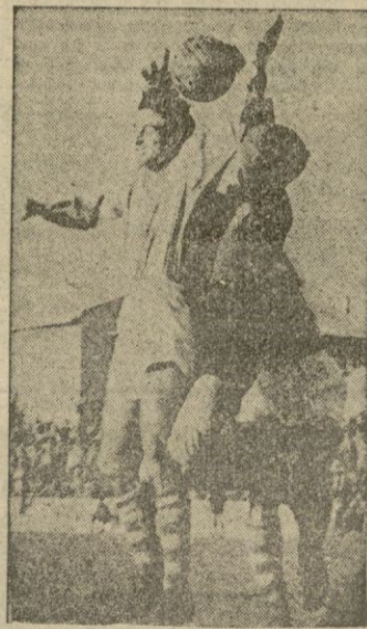
ALORDA intenta un remate de cabeza mientras el portero del Eldense salta para impedirlo