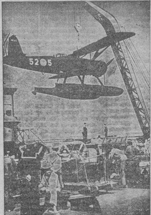
El hidroavión de reconocimiento del crucero "Miguel de Cervantes" va a prestar servicio en las maniobras.

Una hora y media después, el buque mercante respetuoso, arriando e izando su pabellón italiano.