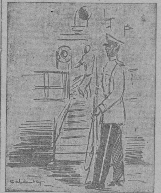
...les has visto de guardia...

La guerra en el Pacífico, guerra de islas, que había que ir ocupando sucesivamente, requería el empleo de tropas embarcadas y aerotransportadas. En Europa, la muralla del Atlántico hubo de ser rota desde el mar. Sicilia y la Península italiana, fueron