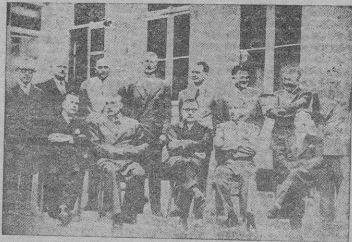
Bruselas. — He aquí el nuevo Gobierno belga social-cristiano, formado para resolver el problema del regreso del Rey Leopoldo. En el centro de la "foto", sentado, el primer ministro Jean Duvieusart, junto a Paul Van Zeeland y Carton de Wiart.

AÑO XII :--: NUMERO 3.297 PRECIO: 50 CENTIMOS Suscripción mensual: 10 pesetas