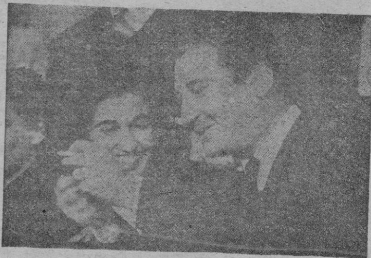
La señorita Carmen Franco y el Marqués de Villaverde durante su época de noviazgo