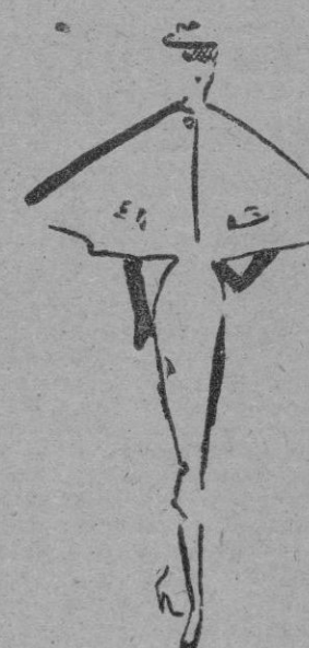
MOLYNEUX Conjunto con capa corta