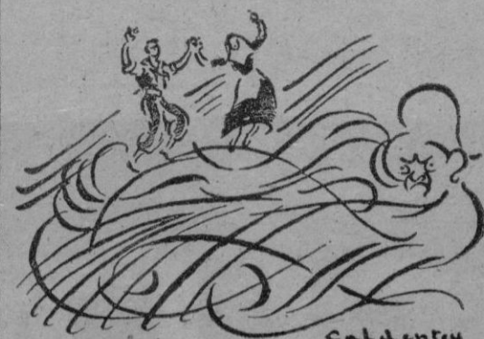
...se plantaron sobre la barriga del VIENTO...