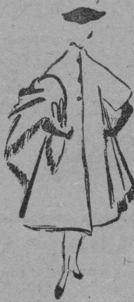
SCHIAPARELLI Modelo oriental