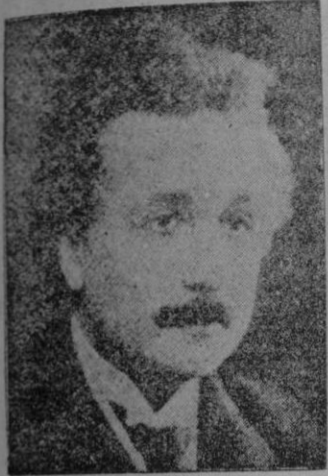
EINSTEIN el judío millonario

Albert Einstein es un premio Nobel, pero es también un millonario judío. Tiene talento para hacer cabalías sobre la paz y la guerra. Por habilidad de síntesis este sabio célebre tiene el secreto de la vida y la muerte anotado en unas cifras claves con apretadas ecuaciones trigonométricas. Einstein ha señalado el peligro que acecha a la humanidad con esa calma fría tan científica como fatalista, que caracteriza a los hombres que se creen estar más allá de la verdad de Dios y esperan la salvación del mundo por un hecho de laboratorio. Dios y el huronador de retortas y aparatos electrónicos, marchan con este huronador de retortas y aparatos electrónicos, marchan con estos tales inteligentes, archisabidos de todo y por todo, vaticinados que tales calamidades sin cuento y pidiendo que no se mueva la mano que lance la bomba hidrógena ni la atómica. ¡A buena hora, mangas verdes!