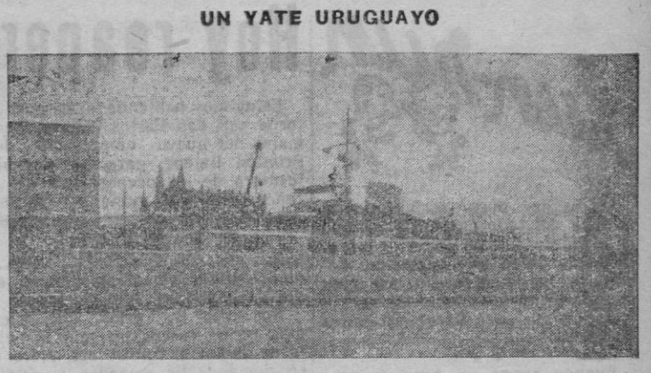
El «Mimosan», de la matrícula de Montevideo, amarrado junto al Club Náutico.