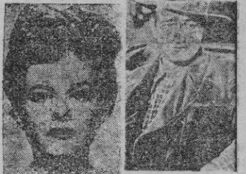
Paulette Goddard — John Wayne

"Piratas del Mar Caribe", sobre un asunto escrito para grandes revistas, a todo color, tales como el "Collier's", es al propio tiempo un excelente tema para el cine que, en un momento dado, puede reunir un reparto de lo más idóneo con dos elementos masculinos tan popularísimos como son John Wayne y Ray Milland y una actriz de tanto temperamento como Paulette Goddard, junto a la femineidad de Susan Hayward.