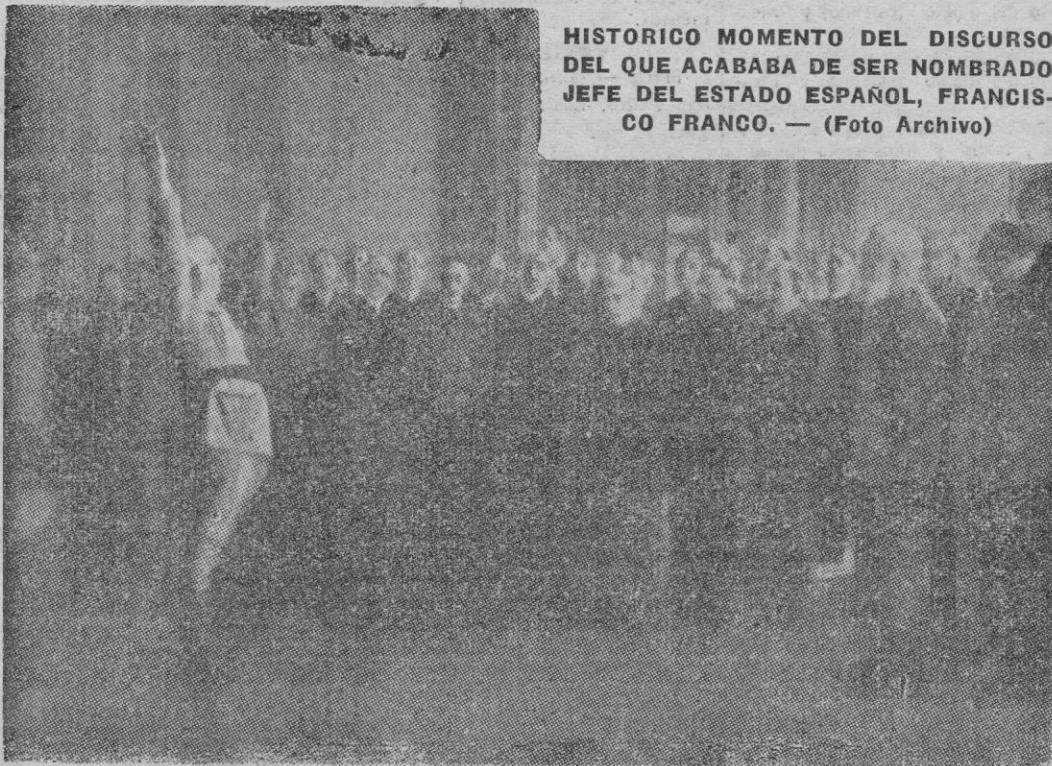
HISTÓRICO MOMENTO DEL DISCURSO DEL QUE ACABABA DE SER NOMBRADO JEFE DEL ESTADO ESPAÑOL, FRANCISCO FRANCO.

A principios de este año asistió S. E. a la IX reunión plenaria del