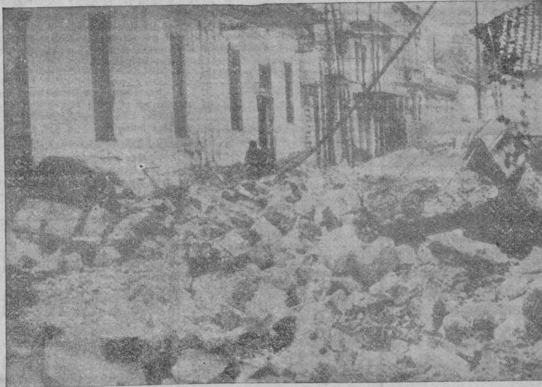
Ambato. — Una vista parcial de la calle principal de esta ciudad completamente destruida a consecuencia del terremoto.