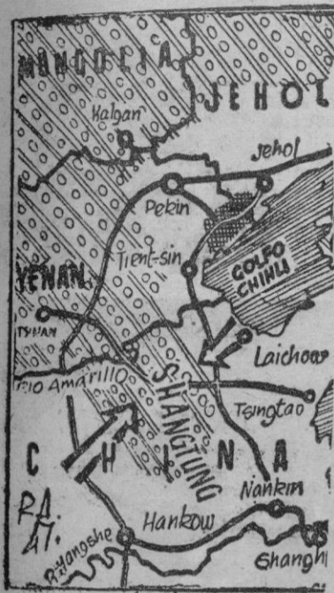
La situación sigue empeorando

Changsha, como acabamos de indicar, se ha entregado sin disparar un tiro. El gobernador de la provincia al habla con el general jefe del primer ejército comunista, negoció la rendición en unas horas, poniéndose decididamente al lado de los que hasta poco antes eran sus adversarios. No es la primera vez que este fenómeno se produce en la guerra de China. Las guarniciones de las grandes ciudades se han unido siempre sobre la marcha al carro del vencedor, para seguirle luego, cómodamente, como si nada hubiera ocurrido hasta entonces. El hecho, que es prueba de la enorme demoralización que reina entre los subordinados de Chang-Kai-Chek, no consiente optimismo alguno respecto del resultado final de la campaña. Se habla de una legión de voluntarios coreanos, filipinos y japoneses, compuesta por unos doscientos mil hombres, que pasarán a China, sin pérdida de tiempo, para luchar al lado de los nacionalistas, pero si los chinos no se baten por su propio país contra el peligro rojo, ¿qué podrá resolver esa legión de voluntarios? El bando gubernamental vive en un ambiente de derrota; la amenaza roja, muy amplia, se extiende desde la provincia de Che-Kiang, al oeste, hasta la propia costa de Tukien, donde Fucheu y Ying-Tai pueden caer de un momento a otro en manos de los guerrilleros de Mao, que infestan la región y