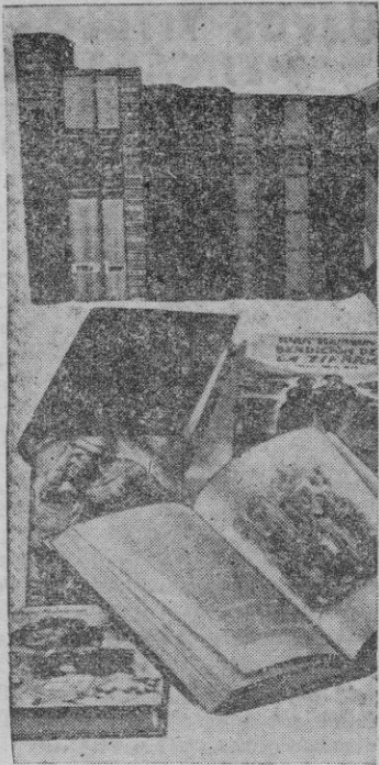
Las cinco hermanas Dionne, han hecho escribir montañas de cuartillas que, traducidas en libros, completarian una importante y bien surtida biblioteca.

preocupado a casa del doctor Defoe para anunciarle la proximidad del parto de su mujer. El doctor Defoe fué rápido a esa casa pobre y se dispuso a asistir a la madre, un caso entre tantos. ¡Bien igno-