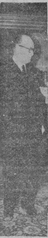
acredor a tal honor y a la gratitud de la nación.—.