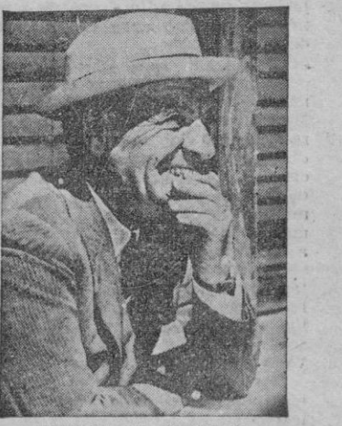
ORTEGA Y GASSET

Espeleados en principio por las incisivas observaciones del retirado general Clay, quien en una ocasión bastante reciente aún dijo que Francfort no había hecho gran cosa por merecer el título de capital de la Alemania Occidental, y por su amor propio como aspirantes al destronamiento de Berlín, los regidores municipales han realizado un esfuerzo tan considerable que de la Primavera al Verano la ciudad más sucia y descuidada de todo el país —y la más cara también— puede ya competir con Bonn, con Stuttgart o con cualquier otra que presume de modelo de pulcritud. El que ha visto Francfort desde 1946 y el que la ve hoy, no la reconoce sino por la aguja inconfundible de su semirreconstruida Catedral. Las calles han sido limpiadas de escombros, el alumbrado multicolor destella por las noches desafiando las restricciones eléctricas que obscurcen a las más empingorotadas capitales de Europa, nuevos establecimientos se abren esplendorosamente todos los