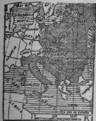
Sobre el mapa de Europa no podrá borrarse jamás la frontera franco-germana.

Desde hace varias jornadas está celebrándose en París el proceso contra Otto Abetz, embajador que fué del III Reich en la capital francesa. De sus propias declaraciones, careos, testimonios y deposición testifical, resulta que nos hallamos ante el caso específico de un «simpatizante». Aclaremos que esa simpatía de Otto Abetz se remonta a los años de preguerra. El futuro embajador había sentido la atracción que para todo espíritu cultivado ejerció sobre nuestros años mozos el «esprit» francés y más especialmente el de nuestras vecinas. Con el zurrón al hombro, se dió a caminar por los campos risueños de las viejas Galias, hasta dar fondo al socaire de la Torre Eiffel. Soñaba —porque, en verdad, su ambición constituía sueño irrealizable— una aproximación franco-germana, sin tener en cuenta quince lustros de «chauvinismo» y antipatía hacia todo lo que pueda oler a «boche». Con optimismo juvenil digno de la causa a que se había entregado, dió conferencias, fundó una revista a mano con Luchaire, contrajo matrimonio con la secretaria de éste y, en fin, hizo cuanto le fue humanamente posible para destruir la barrera de rencores que separan ambas orillas del Rin. Todo fué inútil: la guerra de 1939 vino a echar por tierra esos proyectos. Y un buen día, Otto Abetz se encontró, como por arte de birlibirioque, embajador de su país acerca de la nación cuyo espíritu deseaba conquistar. Nueve años más tarde, cierto Tribunal parisiense lo juzga por «crímenes de guerra».