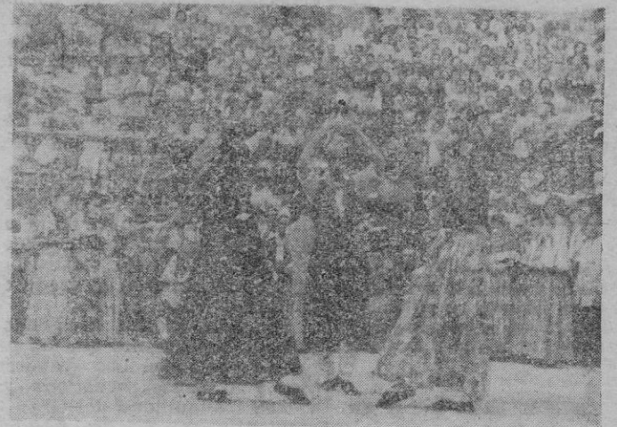
«Aires de Montanya» bailando en la tarde del 18 de Julio, en la gran fiesta de homenaje, organizada por la O. S. de Educación y Descanso.

Mañana por la noche, a las diez y media en la Plaza de Toros de Palma, tendrá lugar, por fin, el formidable festival folk'órico que, organizado por la Parroquia de Santa Catalina Thomás, es el festejo más destacado de las fiestas ofrecidas por aquel vecindario.