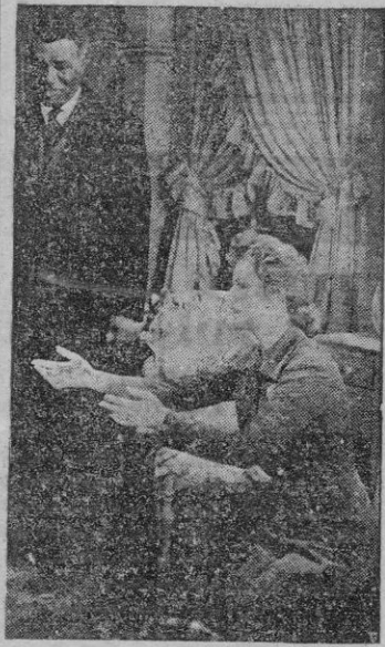
GREER GARSON en su parte de la película "De corazón a corazón"

Hollywood se siente en cierto modo humillada de saber que sus alumnos ganan más dinero que ella. Y no es que miss Mac Donald aspire a ganar más que sus alumnos.