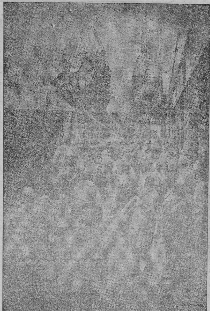
Soldados y marineros trabajan afanosamente en el puerto de Londres, en la carga y descarga de los barcos mercantes, allí estacionados con motivo de la huelga.