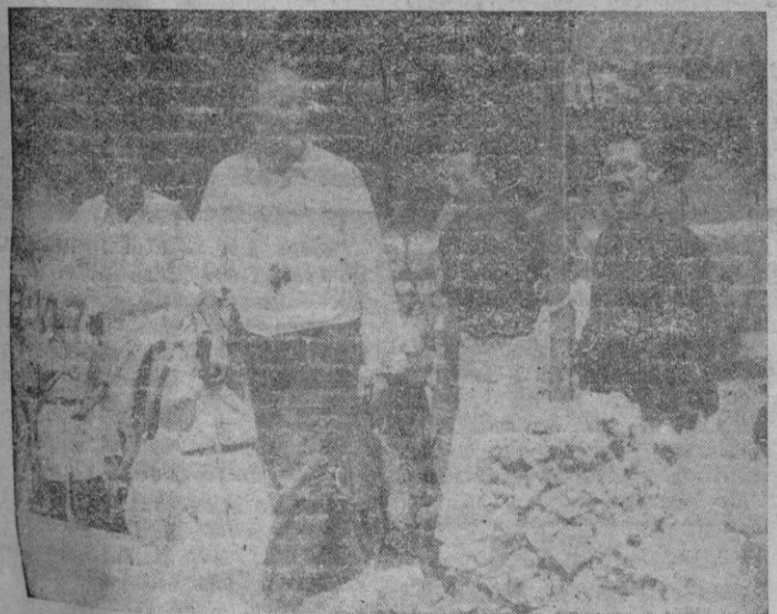
Los Excmos. Sres. Capitán General, y Gobernador Civil y Jefe Provincial, con la Delegada de la Sección Femenina de Falange, durante la visita al albergue «Cruceiro Baleares» instalado en Porto-Colom.