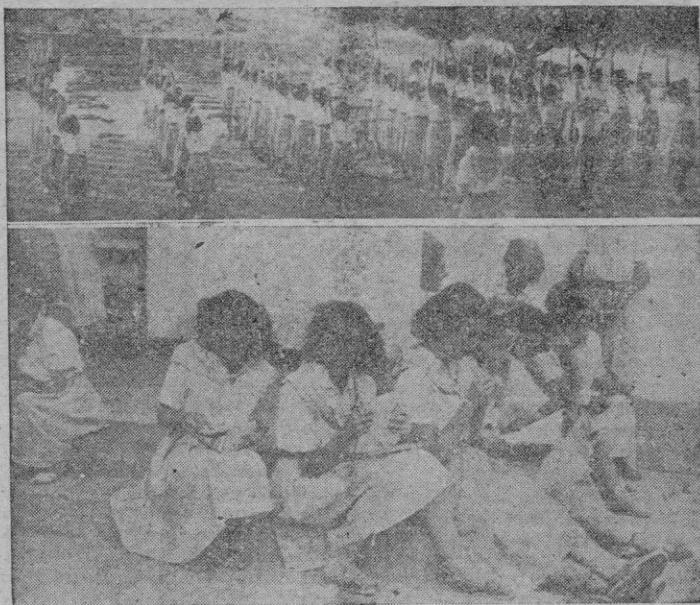
Arriba: La clase de gimnasia. — Abajo: Labores y lectura en un descanso en la jornada del Albergue.

CUANDO llegamos, es medio día agobiante. Bajo los pinos, grupos de muchachas juegan, cosen, leen o charlan. El fotógrafo y el periodista tienen, cuando al final sin que el menor disgusto haya ensombrecido el normal desarrollo de estas jornadas inolvidables... Cinco o seis muchachas se afa-