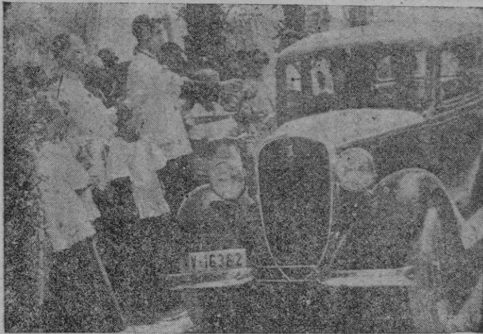
Un momento de la bendición de coches.

Los taxistas también celebraron diversos actos