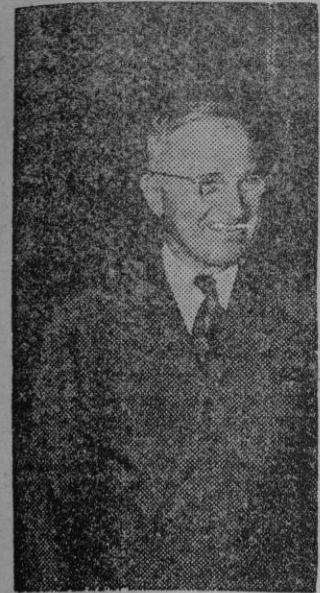
TRUMAN ve el mundo color de rosa.

Truman, uno de los escasos felices mortales capaz de ver todavía el Mundo de color de rosa, en el curso de su conferencia semanal de Prensa, ha afirmado su convicción de que no existe crisis económica y que la paz reinará entre los pueblos. Mientras tal decía, la Bolsa neoyorquina experimentaba una nueva baja. La alarma sobre la crisis inglesa, salvo para los comunistas, causa una honda preocupación internacional, temiéndose en las altas esferas de Washington que haga resquebrajarse la total estructura de Europa. No obstante este optimismo, más para la galería que real, apenas asegurada la ratificación del «Pacto del Atlántico» por el Senado, el Presidente se apresurara a emprender una campaña para obtener de ambas Cámaras la concesión de los primeros mil millones de dólares para armas a Europa.