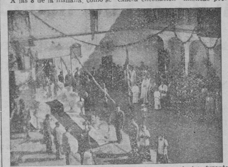
La Virgen de Lluch en el patio de la Prisión Provincial durante los solemnnes actos que se celebraron ayer

POR LA MAÑANA Continuaron ayer, con esplendor imposible de describir detalladamente, los actos que en honor de Nuestra Señora la Virgen de Lluch vienen celebrándose en la Iglesia Parroquial de San Miguel.