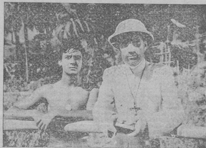
Una escena de «La miés es mucha»

“La miés es mucha”, film de Sáenz de Heredia, con ser un canto completo y exaltado a la Misión católica de España, significa también una película de profundas cualidades poéticas, que lejos de conformarse en una parte que podríamos llamar expositiva y emplear recursos de documental, crea una alta atmósfera dramática, un interés positivo que se mantiene a lo largo de todo el film.