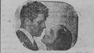
Una escena de la película

(Born, Capitol e Hispania) Un caso de egoísmo rayano en la locura. Tema muy cinematográfico, lleno de acción y rezumante de emociones. Una película, en fin, con todos los elementos precisos para que el «gran público» salga de las salas plenamente «satisfecho».