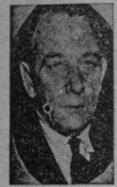
KIRK Un almirante que deberá firmar en Moscú

En París están reunidos estos días diplomáticos norteamericanos, ingleses y franceses, preparando la reunión de los ministros de Asuntos Exteriores, que comenzará el 21 para las potencias occidentales y el 23 para éstas y el representante soviético.