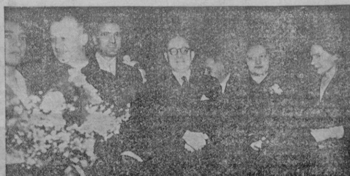
El Ministro de Educación Nacional con el Arzobispo de Granada y otras personalidades de la Misión española en uno de los actos celebrados durante su estancia en la Ciudad Eterna