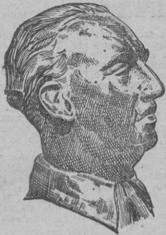
del Ministerio del Ejército, con uniforme de gala, que rindió honores.

A las seis y cuarto en punto de la tarde llegó S. E. el Jefe del Estado al Palacio de las Cortes, ante el que formaba una compañía del Batallón