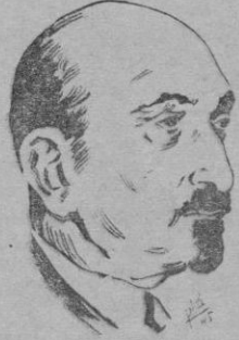
HAIM WEISMANN conductor del moderno sionismo

Es inteligente, hábil y fuerte. Desempeña en el mundo árabe un gran papel y su pueblo, para el cual siempre fue generoso e inquieto y pone a prueba sus grandes cualidades.