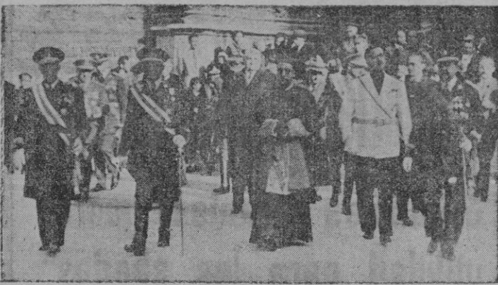
Nuestras primeras autoridades saliendo de la Basílica de San Francisco, después de asistir a la misa solemne, organizada por el Arma de Aviación, en honor de Nuestra Señora de Loreto.

A su excelsa Patrona la Virgen de Loreto, dedicó ayer la Zona Aérea de Baleares, en la iglesia Basílica de San Francisco, solemne misa.