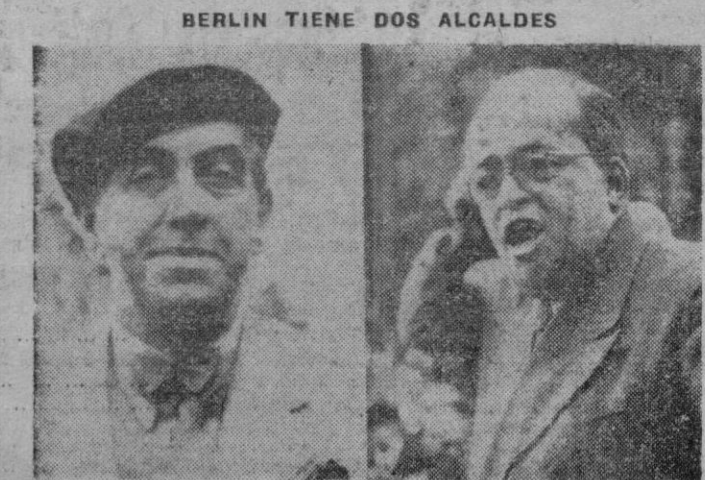
A la izquierda el socialista Ernst Reuter, nombrado Alcalde de Berlín por unanimidad en la Asamblea del Ayuntamiento Occidental y que será reconocido por los norteamericanos, británicos y franceses. A la derecha, Friedrich Ebert, alcalde del Ayuntamiento comunista de Berlín, reconocido por los rusos.

Nueva York 10. — Según una información facilitada por una compañía de telecomunicación, el Generalísimo Chang-Kai-Chek ha proclamado la ley marcial en toda China. — Efe.