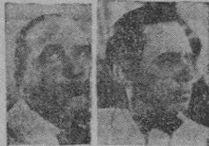
OLSEN Y JOHNSON

De nuevo y para nuestro regocijo, otra película de Olsen y Johnson, esos dos payasos incansables, entusiastas de la comedia extravagante, codornicesca, inesperada.