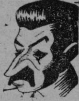
STALIN continúa en su impenetrable silencio.