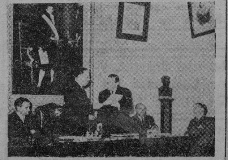
Lima.—El Dr. Pedro Lain Entralgo recibe del Presidente de la Academia de Medicina del Perú el título de miembro de honor de dicha corporación. Al acto asistió el Embajador de España señor Castiella, y otras personalidades.—.