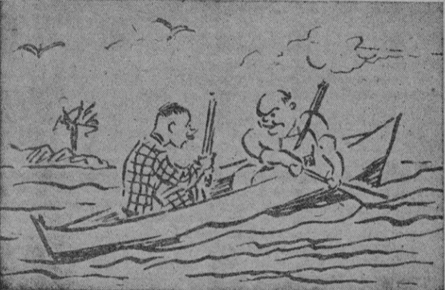
—Este barquito..., este barquito... — acusó Pelegrín

Le ayudó a erigirse. Un confuso bullo se alzaba al costado de la barquilla. Pelegrín extendió los brazos y se asió al borde de la gran barrica amparada por altos yerbajos.