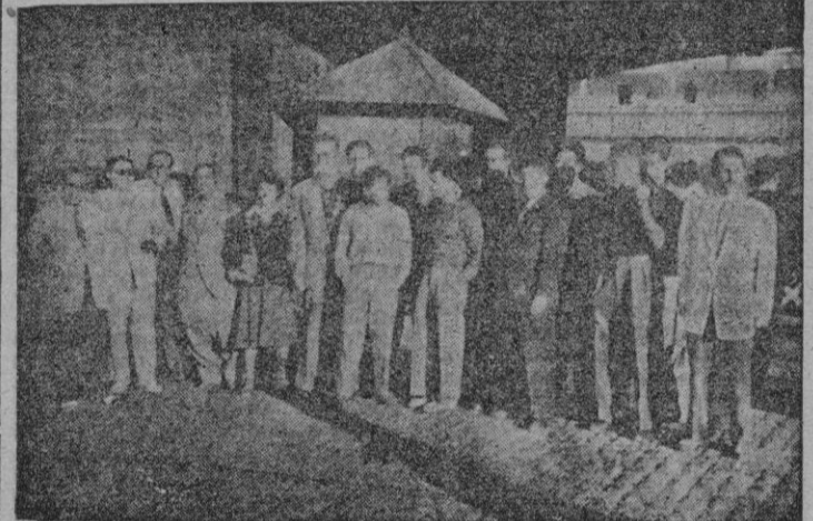
El grupo de nadadores del «Paris Université Club», junto con los dirigentes del C. N. Palma que acudieron al muelle a esperarles, posan para BALEARES, a su llegada a nuestra ciudad.

En el partido de polo acuático, los franceses se mostraron superiores a nuestro endeble equipo, que ayer salió falto de Calafell. Es un equipo que no practica más que un juego mediocre pero todos sus hombres están poseídos de una gran rapidez, con lo cual logran desmarcarse con una facilidad enorme. El partido en conjunto fué bastante malo, y el arbitraje de Paco Rever estuvo a