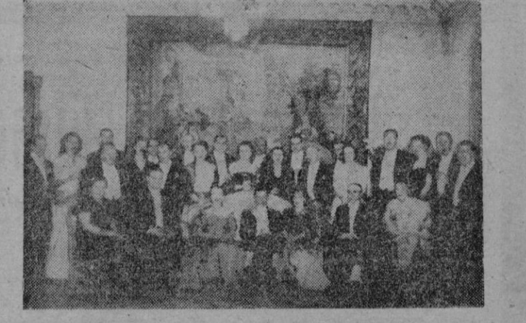
Lima. — El general don Armando Revoredo, Presidente del Consejo y Ministro de Asuntos Exteriores del Perú, rodeado de los asistentes a la comida de gala celebrada en la Embajada de España en esta capital y durante la cual le fué impuesta la Gran Cruz de Isabel la Católica por nuestro Embajador, señor Castiella.