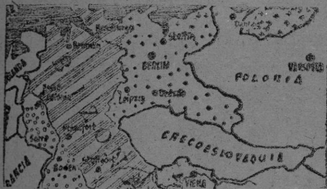
Un país inventado por la masonería internacional que pasará a manos de Moscú.

El voto de un analfabeto vale tanto como el de un profesor de Economía Política, porque a la hora de regir el país puede hacerlo, según la teoría checoslovaca, un retrasado mental con tanta lucidez como un hombre que se ha pasado la vida de codos sobre un pupitre consultando en los libros el proceso de los universales problemas políticos o alumbrando ideas rectoras. Esta monstruosidad es posible en la terza Arcadia bolchevique.