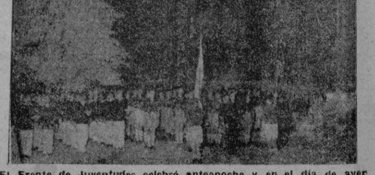
El Frente de Juventudes celebró anteanoche y en el día de ayer diversos actos con motivo de la celebración del aniversario de la Victoria española. — (Foto Juanet) (Información en segunda página)

Los ingleses sitian un puesto de control ruso en la capitol germana