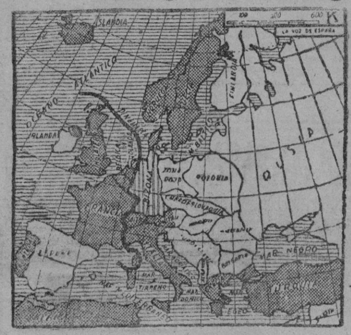
Mapa de la Europa diplomática política y militar actual; los países del Bloque Occidental, alianza militar fundamentalmente, aparecen rodeados por un trazo grueso. Italia se ha unido a Francia con fuertes acuerdos comerciales. Grecia y Turquía están realizando una interesante colaboración en ambos órdenes, el militar y el económico. La Zona alemana está en curso de integración en el bloque de los beneficiarios del plan Marshall, que en el mapa están señalados con un cuadrículado.