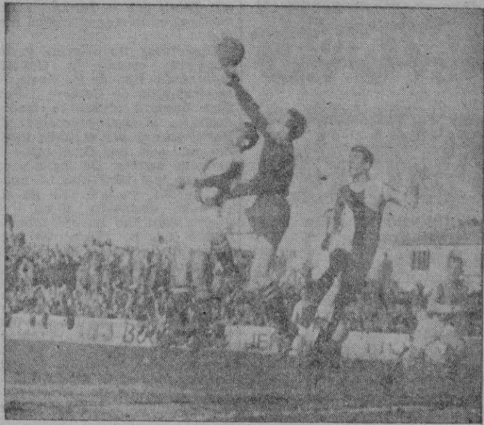
El meta catalán despeja de puños, un balón que había centrado Gay, acosado por los delanteros atléticos.