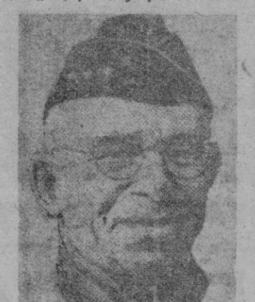
OMAR NELSON BRADLEY, EL SUCESOR DE EISENHOWER. Fue compañero de clase de éste en la Academia de West Point, y

Eisenhower anunció finalmente que ahora pasará una temporada de pesca y que comenzará a escribir sus memorias.