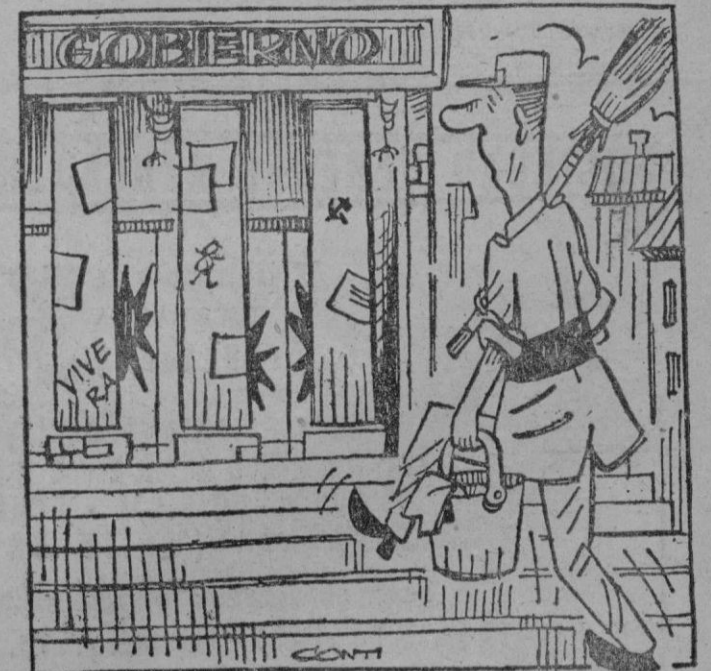
—Antes de empezar el trabajo hay que limpiar eso.