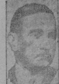
MANIU el único obstáculo que quedaba a los agentes de Moscú

«La decisión de adelantar sobre la fecha prevista el proceso que ha de celebrarse en Bucarest contra el ex jefe del partido campesino de Rumania doctor Maniu no significa, según se opina en Londres, el menor cambio de las intenciones comunistas...»