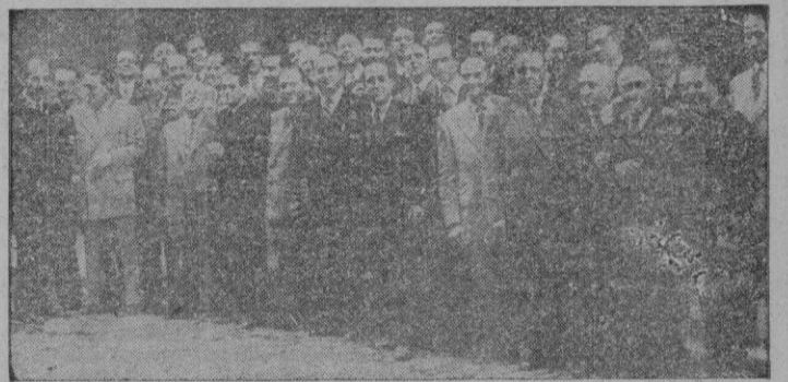
Madrid.— Los asambleístas que han asistido estos días al Congreso Nacional de Fotógrafos, reunidos con el Jefe Nacional del Sindicato del Papel, Prensa y Artes Gráficas.

Varsovia 31.— Un portavoz del Gobierno ha protestado en duros términos contra la «campana subrepticia» que tiende a insinuar que Mikolajczyk no ha aparecido porque fué detenido por la policía polaca. Dicho portavoz dijo que no tenía nada de particular que Mikolajczyk hubiera desaparecido en el momento en que lo creyó más oportuno, pues, «los ciudadanos polacos no están sometidos al espionaje de la policía polaca». También afirmó seriamente que los polacos «gozan de plena libertad de movimiento».—Efe.