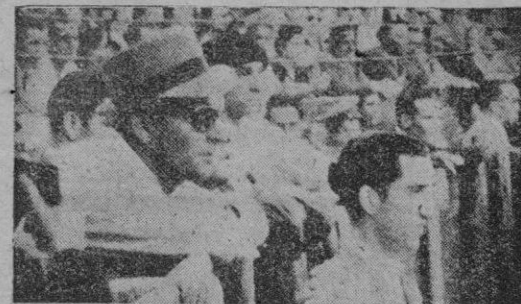
Un descanso en la lidia. «Manolete» observa atentamente. Entre barrera permanece el apoderado.

el mutismo y digimos esas cuatro cosas insustanciales que uno suele soltar cuando no sabe qué decir: — ¿Ha llegado usted esta mañana? — En el coche? — ¿Cansado, verdad? Entre cada pregunta hubo una larga pausa. La cabeza de Camará dijo que sí tres veces y llamamos de nuevo.