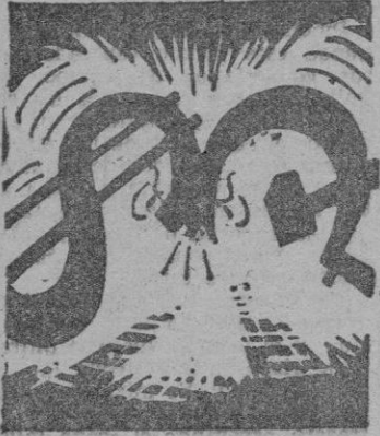
y... entre tanto.

Cunde en la opinión inglesa una psicosis de disgusto contra Estados Unidos, enojo que hoy se ha exacerbado al reproducir la Prensa los comentarios e informaciones que publican los diarios yanquis acerca de los incidentes derivados del desembarco de judíos en Hamburgo.