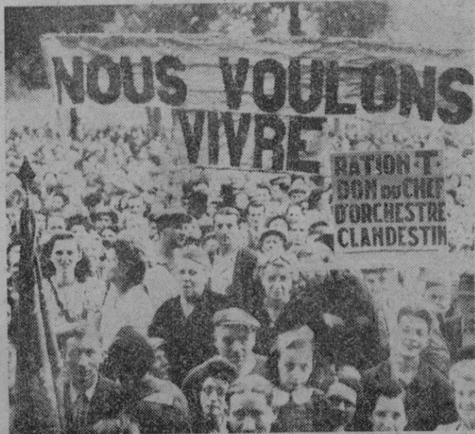
Paris. — Así dice este cartel llevado por los parisienses en manifestación organizada por los sindicatos de alimentación, como protesta por la falta de alimentos de primera necesidad.