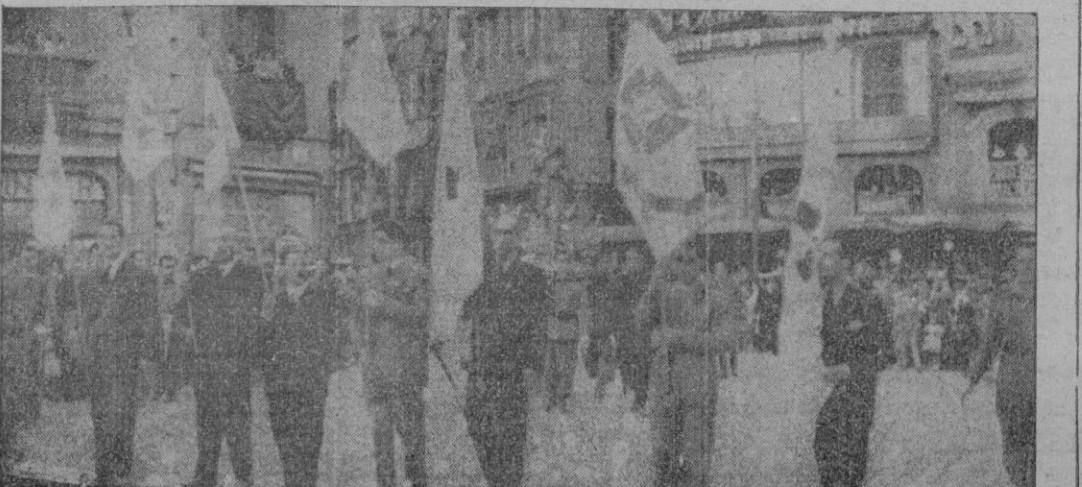
Los estandartes y guiones de Acción Católica que figuraron en la procesion del Corpus Christi, al pasar por la Plaza de Cort.