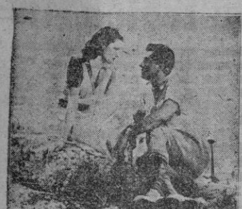
Los protagonistas del film, Margaret Lockwood y Stewart Granger

Dos casos desesperados, una joven pianista y un ex-combatiente, desahuciados por los médicos, se cruzan en unas vaca-