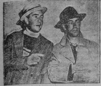
Una escena de «Fantasía de estrellas»

Ahi se cuenta como el amor por un marino ocasionó la organización de un festival en honor