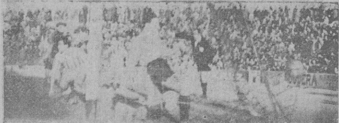
Uno de los goles conseguidos por el Mallorca

estos últimos se cansaron de enviar balones a los delanteros sin conseguir nada práctico de su parte. El Betis... ya no es el Betis. No es aquel equipo que practicaba aquel fútbol de filigrana apoyado todo en la magnífica actuación de siempre de su interior Pineda, sino en el extremo, retiene algo de lo que tuvo, pero va pasando ya y Coll, apela a sus marrullerías nada nobles y la línea media lo mismo para acabar en una defensiva que se abusa de las violencias.