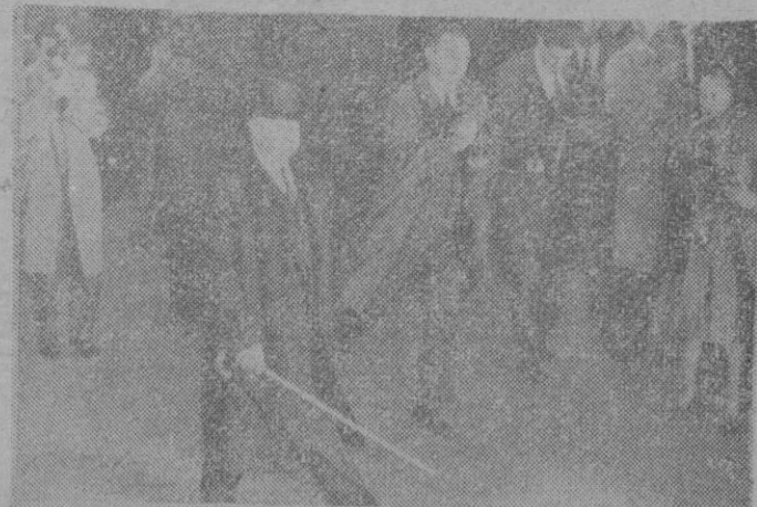
El Presidente del poderoso Sindicato de Mineros norteamericanos, el anticomunista John Lewis, que se ha hecho famoso por la huelga, es asediado por una nube de fotógrafos a su llegada al Juzgado Federal del distrito de Columbia.

Washington, 7. — El Presidente del Sindicato Minero, John Lewis, ha anulado la huelga nacional del carbón y ha ordenado que todos los mineros vuelvan a su trabajo el lunes próximo. La orden dice que deben trabajar hasta el 31 de marzo, en virtud del contrato suscrito con el Gobierno. Esta decisión afecta a todas las minas de hulla que se encuentran paradas desde hace 17 días.