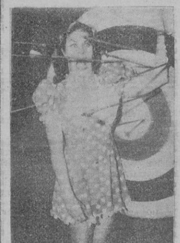
Una escena del «film».