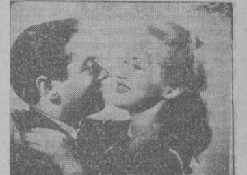
Una escena del «film».