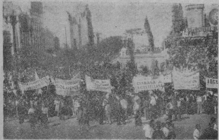
En la foto vemos la gran manifestación de obreros frigoríficos bonaerenses estacionada frente al Congreso Nacional para solicitar la pronta aprobación de sus estatutos...

solucionando la huelga de trabajadores frigoríficos tras una noche entera de discusión