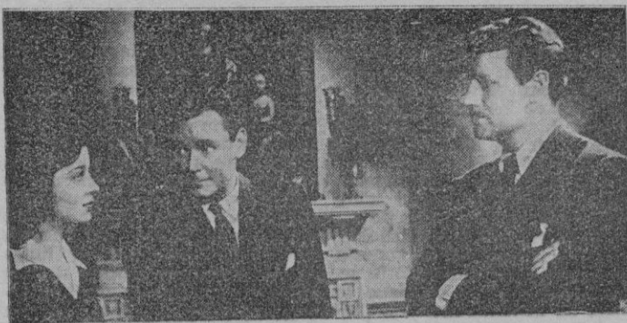
Una escena de «Misterio en la noche»