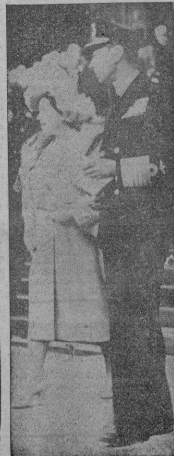
Los Reyes de Inglaterra a la salida de la Misa celebrada en la Catedral de San Pablo para pedir por el buen éxito de las Naciones Unidas.